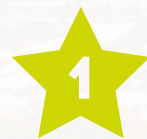
ФОТО - КОНКУРС «ПРИБУЖСКОЕ ПОЛЕСЬЕ В ОБЪЕКТИВЕ»